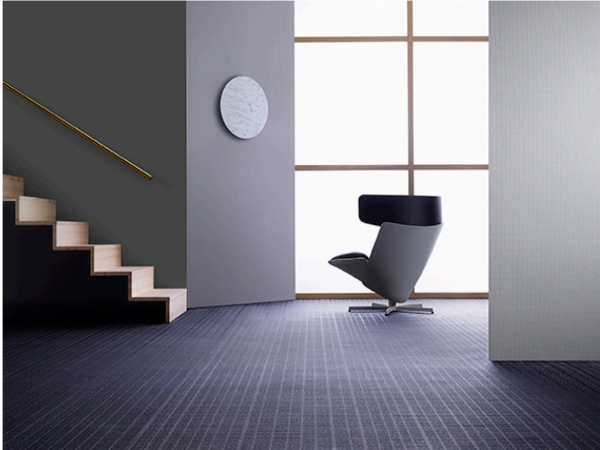
BOLON BY YOU – Grid Grey Lavender Gloss

COMMUNIQUÉ DE PRESSE POUR DIFFUSION LIBRE