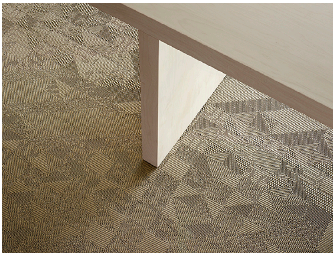
BOLON BY YOU – Geometric Beige Sand Gloss