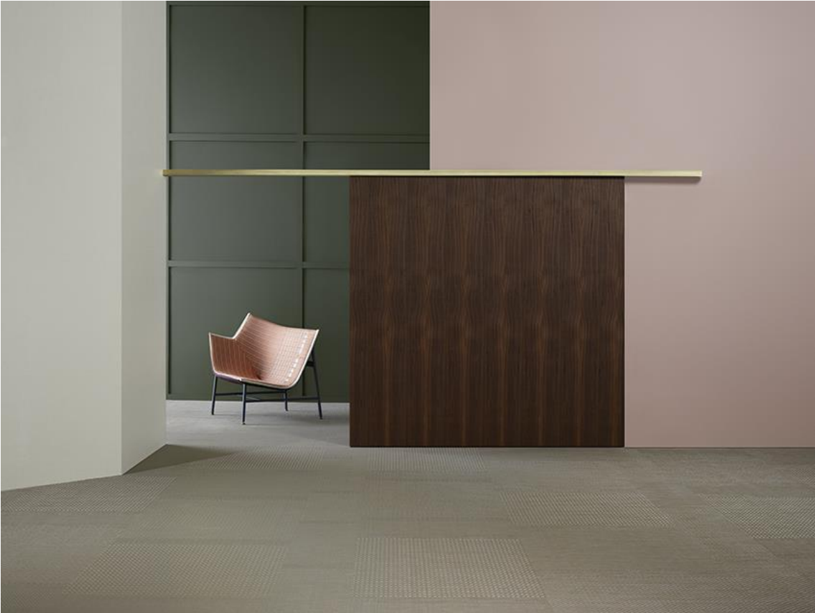
BOLON BY YOU – Weave Beige Sand Gloss