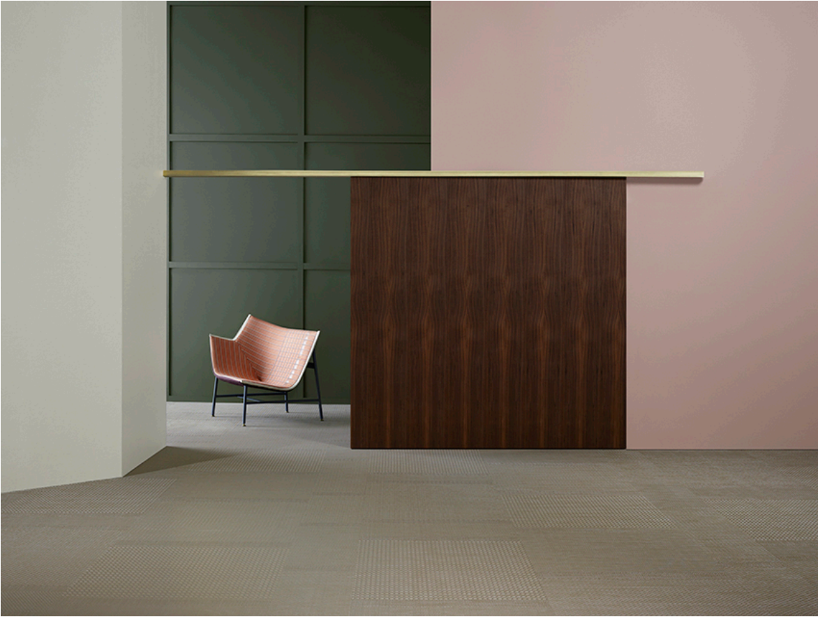
BOLON BY YOU – Weave Beige Sand Gloss