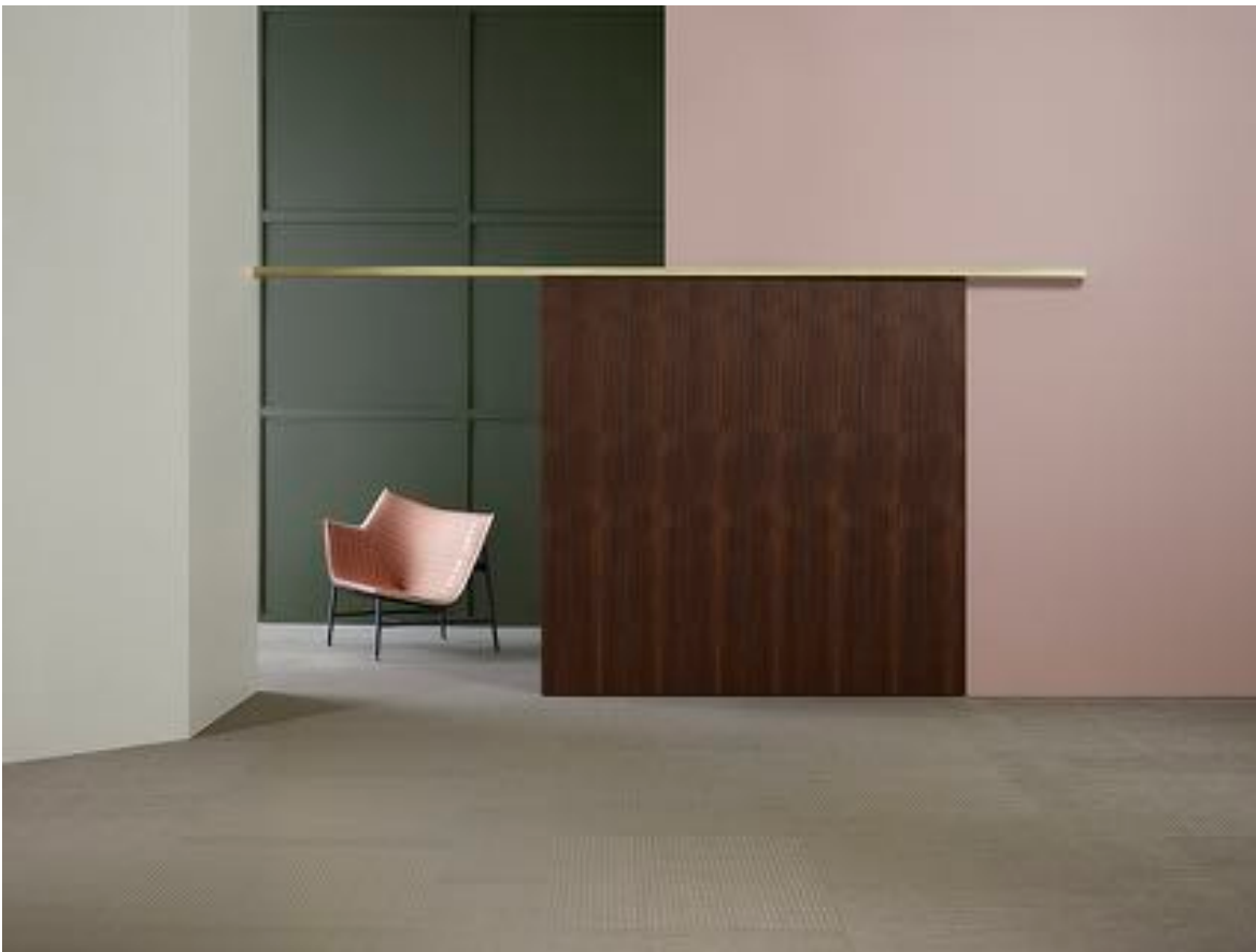
BOLON BY YOU – Weave Beige Sand Gloss