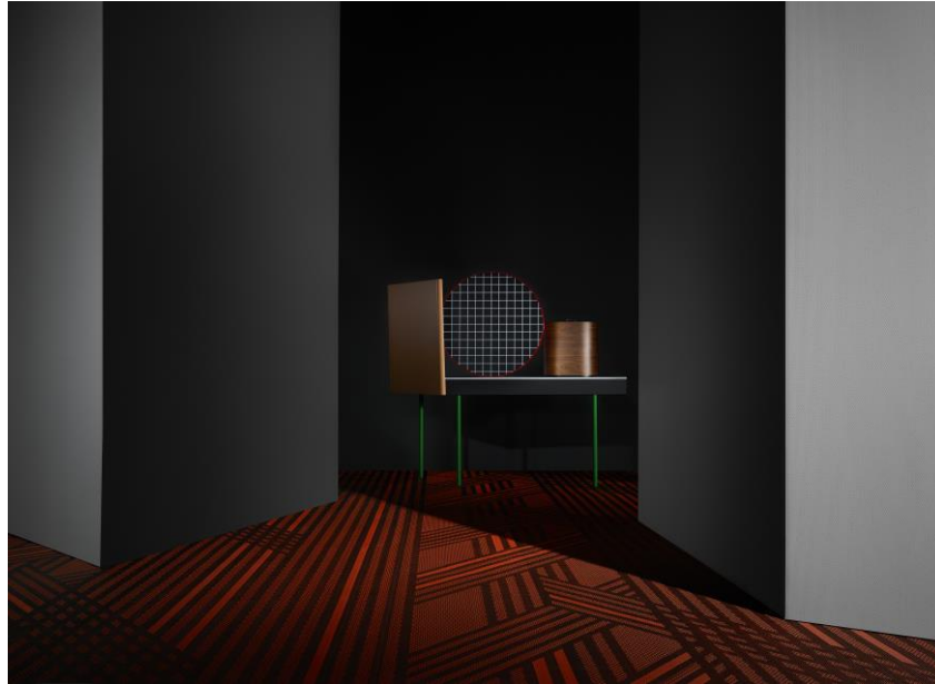
BOLON BY YOU Stripe Black Peach Orange

Pressmeddelande – för omedelbar publicering